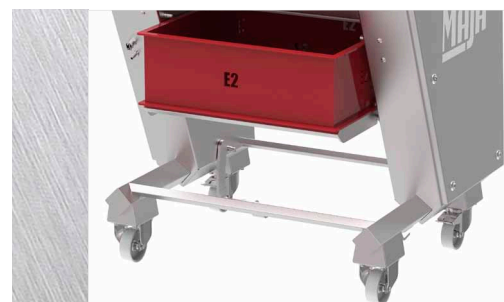
EVM 5006: erhöhte Kübelposition