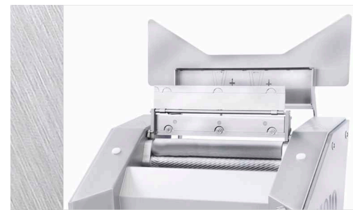
EVM 5006: Reinigungsstellung