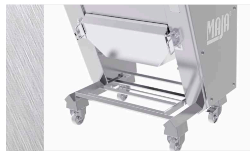
EVM 5004: Vliesschacht