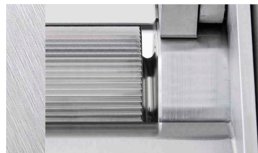
Reinigungsfreundliche Bauweise: Hygienradius an der Transport- und Abstreiferwalze