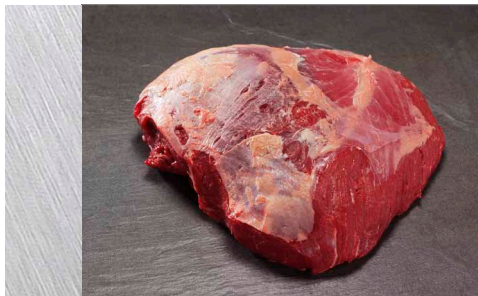
z. B. Rinderhüfte vorher...