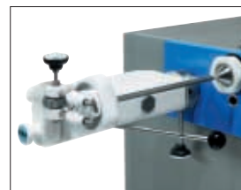
Main automatique en rotation pour des boyaux artificiels et naturels